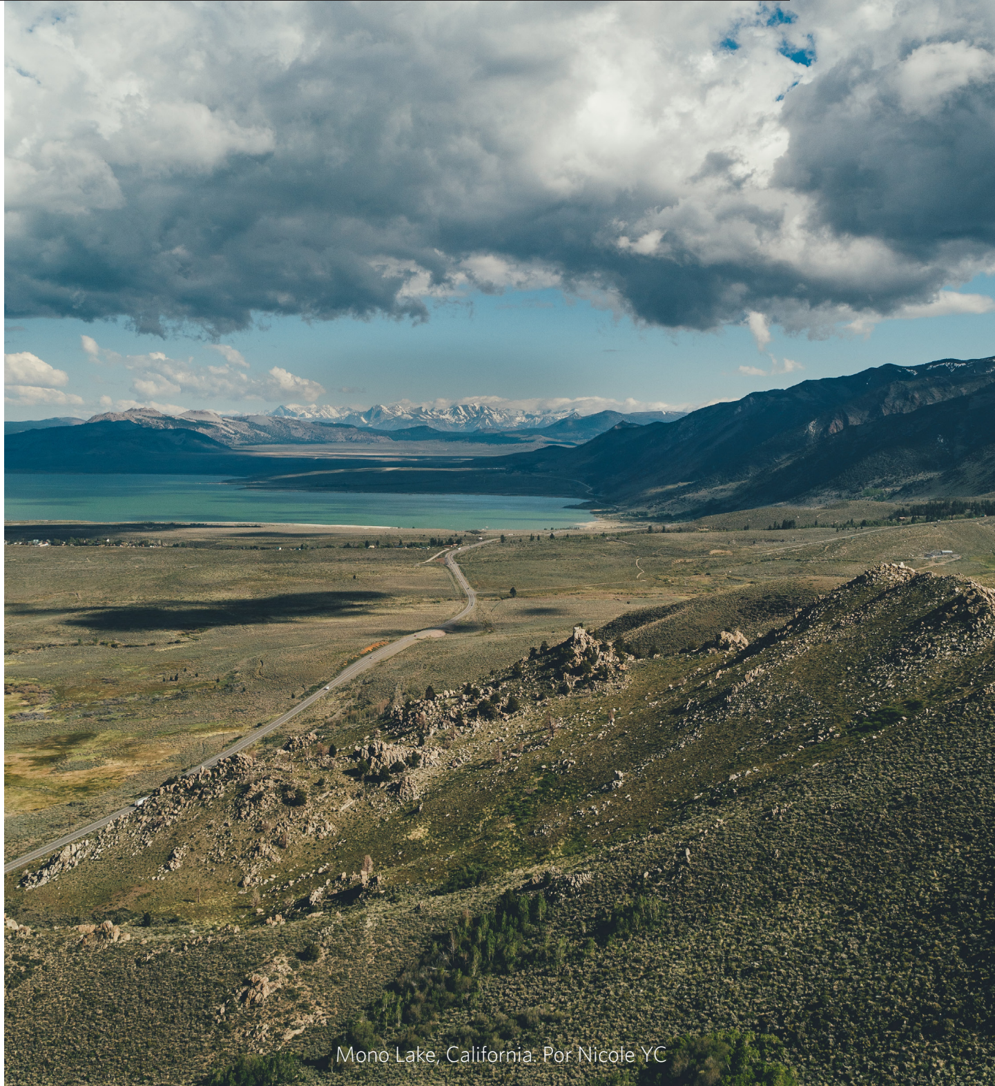
Mono Lake, California. Por Nicole YC