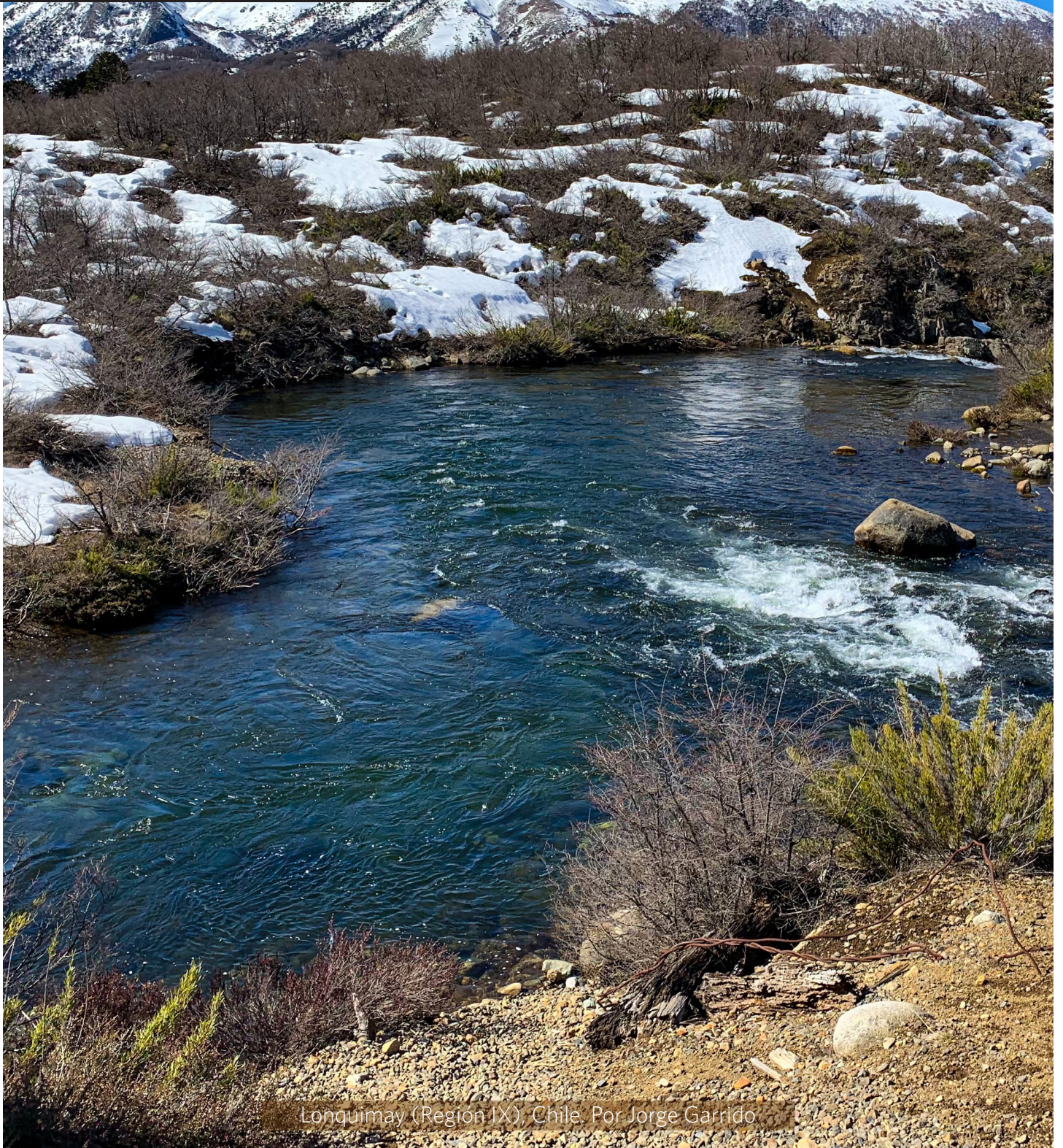
Longuimay (Región IX), Chile.